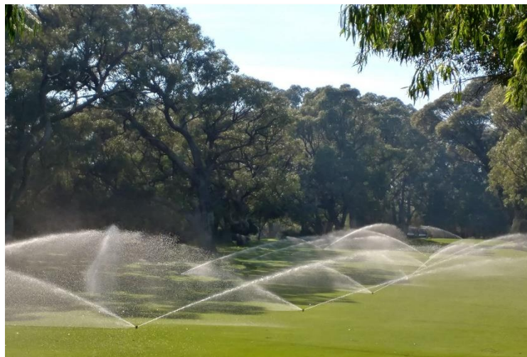
公共緑地・ゴルフコース